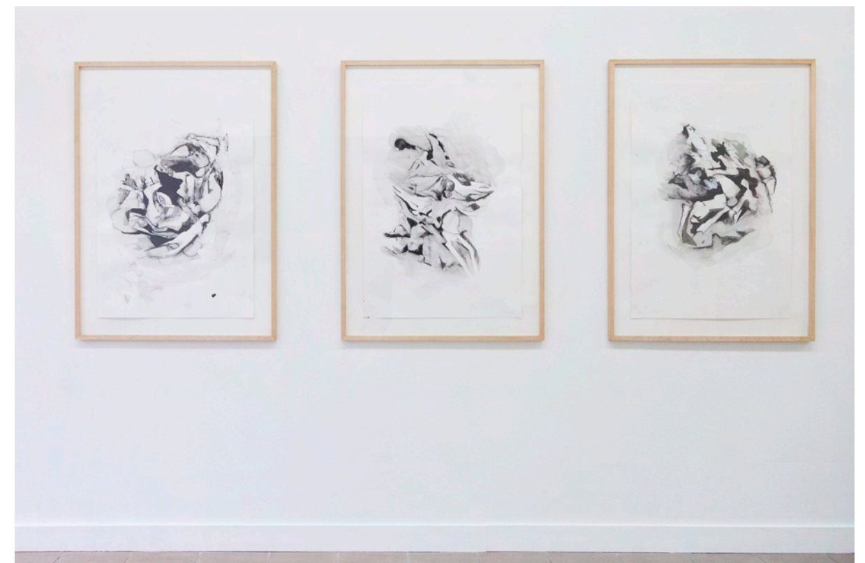
Alke Brinkmann · Patterns of Mankind I, II, III, je 100 cm x 70 cm, Tusche und Aquarellstift auf Papier, 2017